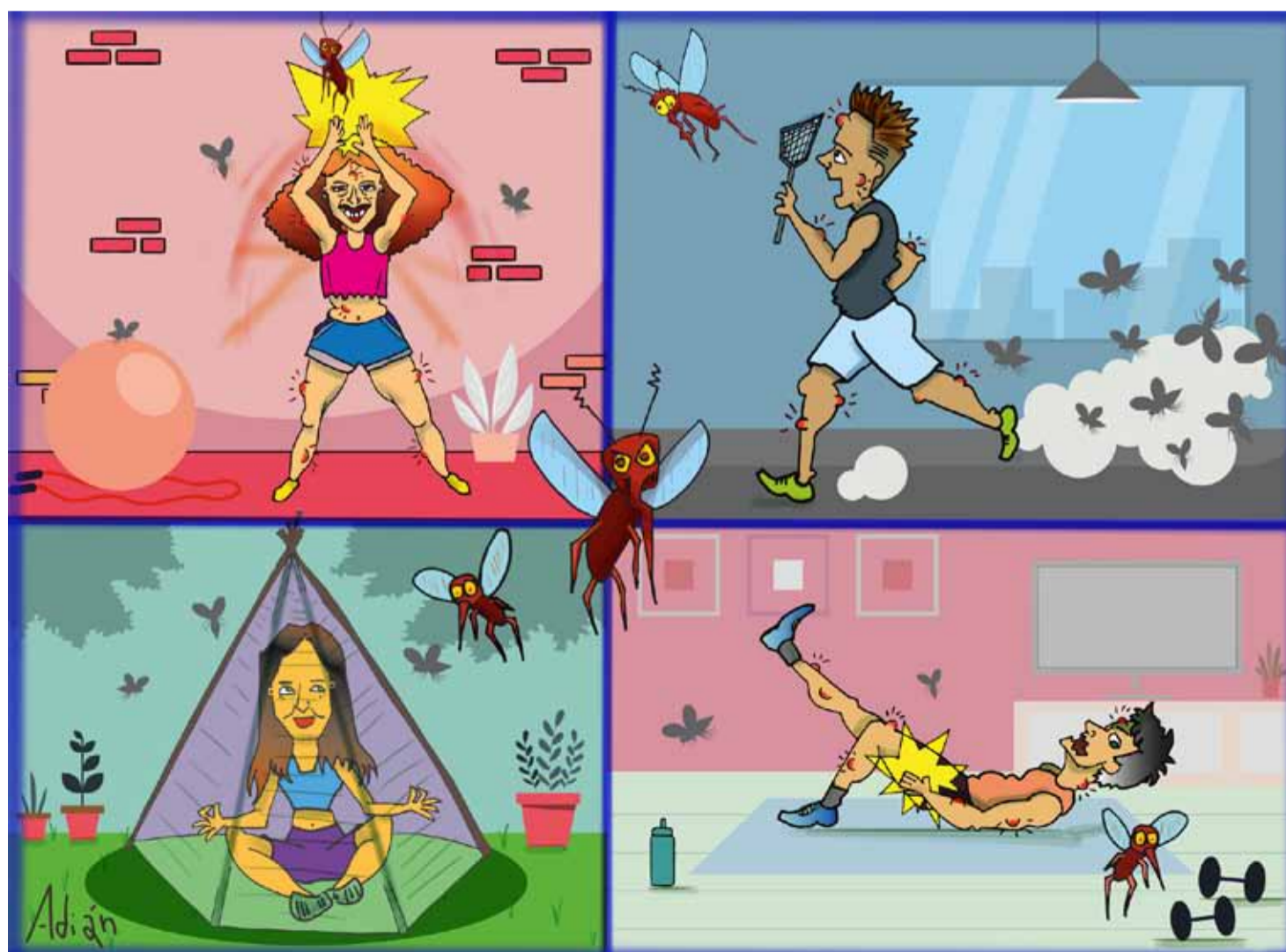
Entre manotazos y zapateos, suplimos ir al gimnasio peleando con los mosquitos

y abril, como refuerzo en esta situación, concretamente que duplique los $ 1.065 que deposita. De lo contrario estaremos exponiendo a los sectores más vulnerables a una segunda pandemia: el hambre”.